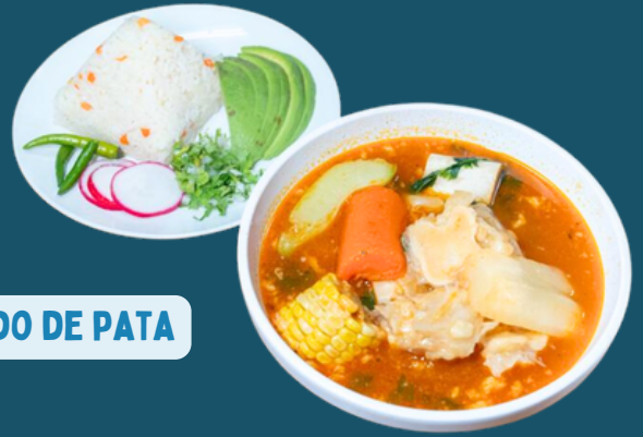
CALDO DE PATA