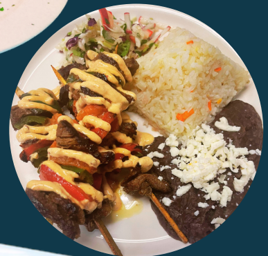
BROCHETAS DE RES