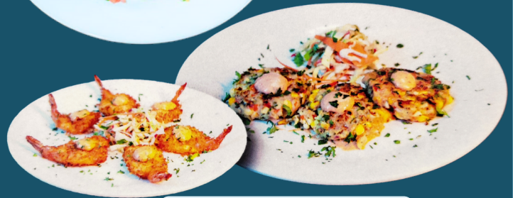
CAMARONES EN COCO

These items are cooked to order. Consuming raw or undercooked meats, poultry, seafood, shellfish, or eggs may increase your risk of foodborne illness .